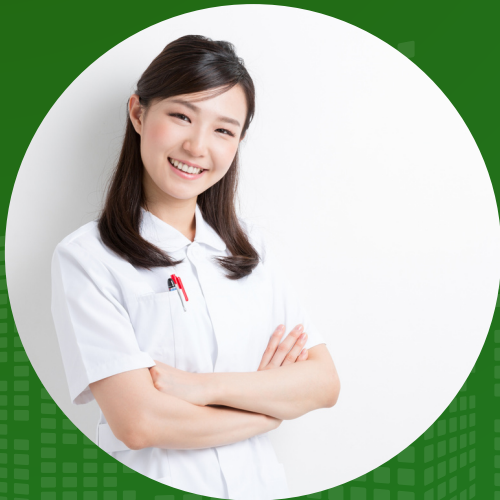
Kaigo (perawat lansia)