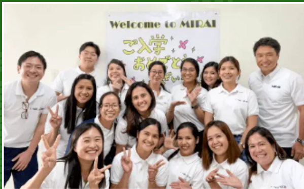
Sekolah Cavite (Filipina)

Mirai.Co.Ltd telah membuka kemitraan kerjasama di 3 negara. Yaitu Bangladesh, Filipina dan Indonesia. LPK Hikari Sukses Mulia adalah satu-satunya kantor perwakilan Mirai. Co.Ltd yang berada di Indonesia.