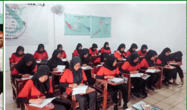
Sekolah Bekasi (Indonesia)