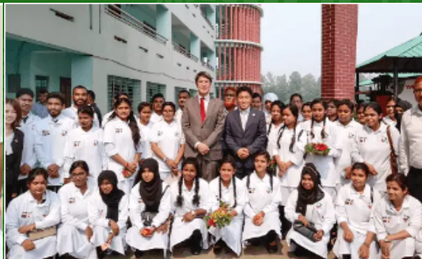
Sekolah Bogra (Bangladesh)